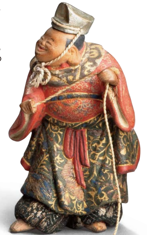
加茂人形 大黒天、恵比寿(七福神のうち) 江戸時代