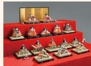
稚児雛十五人揃 野口光彦作 昭和時代初期

本展では、近代に描かれたおもちゃ絵や、創作人形作家による雛人形等を中心に紹介します。特に、野口光彦による愛らしさあふれる稚児雛十五人揃は必見です。