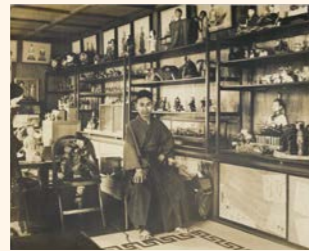
西澤笛畝 自宅兼研究所にて 昭和時代

当館コレクションの礎を築いた西澤笛畝(1889-1965)は、日本画家、人形玩具研究家として活躍し、人形の文化芸術振興に寄りました。笛畝の絵画作品やコレクションを通じ、その人物像や仕事の軌跡を紹介します。