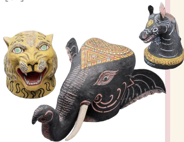
タイ 張子の被り物(左より)虎/象/馬 1931年頃

当館では、大正・昭和の日本画家で、人形玩具研究家・収集家でもあった西澤笛畝の集めた約3,500点に上る人形等を所蔵しています。本展では、笛畝コレクションのなかから、いまや希少となったユニークな人形の数々を、笛畝の収集の軌跡とともに紹介します。