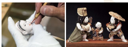
人形作りの様子(面相描き)

常設展示の展示室1・2では定期的に展示替えをし、当館のコレクションを紹介しています。